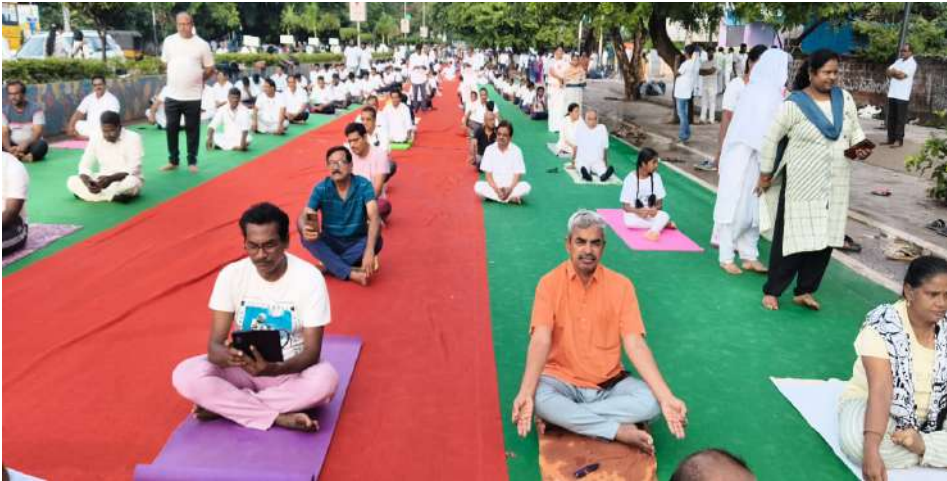
District Cooperative Officer, East Godavari long with Staff