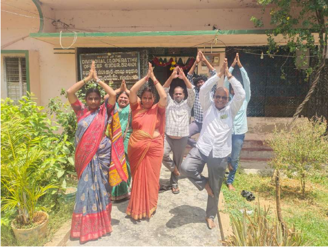
➤ విభాగ సహకార అధికారి వారి కార్యాలయము, గూడూరు