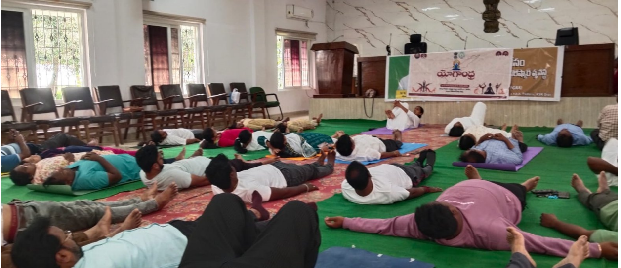
ITDA OFFICE STAFF AND DCO OFFICE STAFF :-