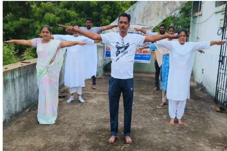
DCAO Office Nellore