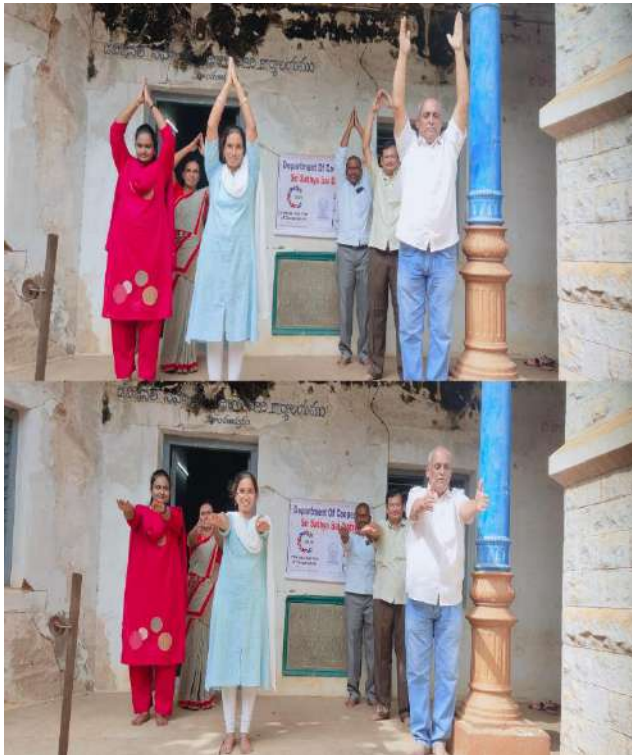
Divisional Cooperative Office, Hindupur