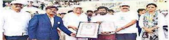
తెలుగు బుక్ ఆఫ్ రికార్డు ద్రువపత్రం కలెక్టరు, ఎమ్మెల్యేలకు అందజేస్తున్న సంస్థ ప్రతినిధి