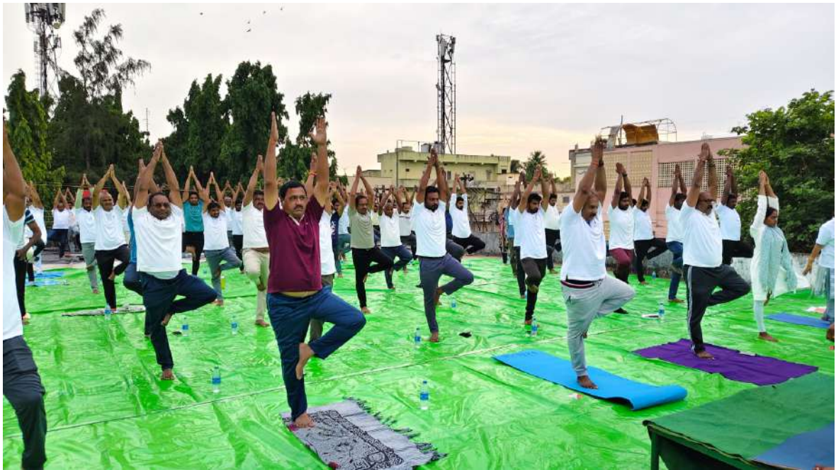
District Co-operative Officer, Eluru