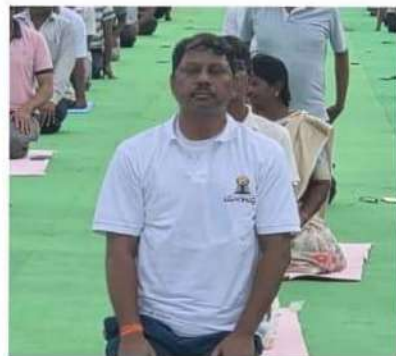
DCO Nellore at 11th International Day of Yoga at ACSR Stadium Nellore

DISTRICT COOPERATIVE OFFICER SPS NELLORE DISTRICT