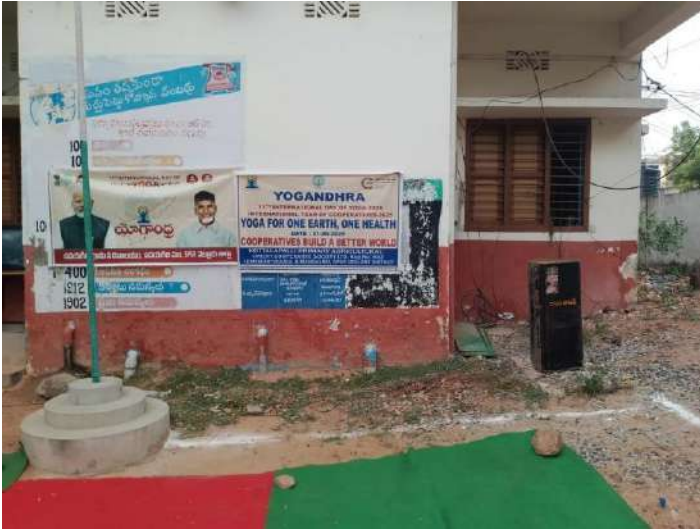
SDLCO Office Udayagiri