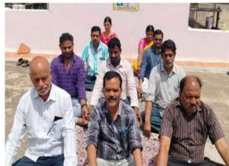
Divisional Cooperative Office, Dharmavaram