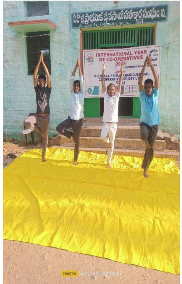
International Yoga Day conducted at Rolla PACS