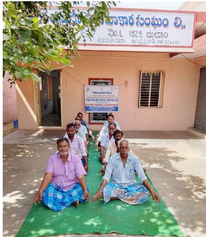
➤ మల్లం ప్రాథమిక వ్యవసాయ సహకార సంఘం