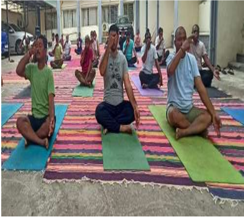
మామిడాలపాడు ప్రాథమిక వ్యవసాయ సహకార సంఘం