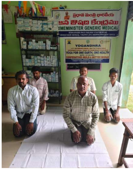
➤ వెంకటగిరి ప్రాథమిక వ్యవసాయ సహకార సంఘం