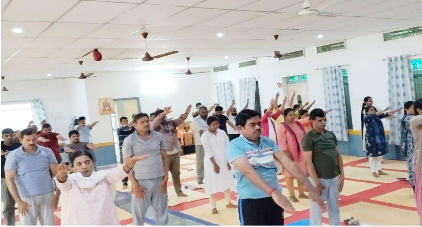
Figure 1 KDCCB RO

11వ అంతర్జాతీయ యోగా దినోత్సవం 20 25 సందర్భంగా జూన్ 21వ తేదీన రీజినల్ ఆఫీసును కృష్ణ సహకార బ్యాంకు లిమిటెడ్ ,విజయవాడ నందు మరియు సంఘాలలో యోగా కార్యక్రమాలు విజయవంతంగా నిర్వహించడం జరిగినది. ఈ కార్యక్రమంలో జిల్లా సహకార అధికారి వారు, కార్యాలయ సిబ్బంది మరియు సహకార సిబ్బంది పాల్గొనడం జరిగినది