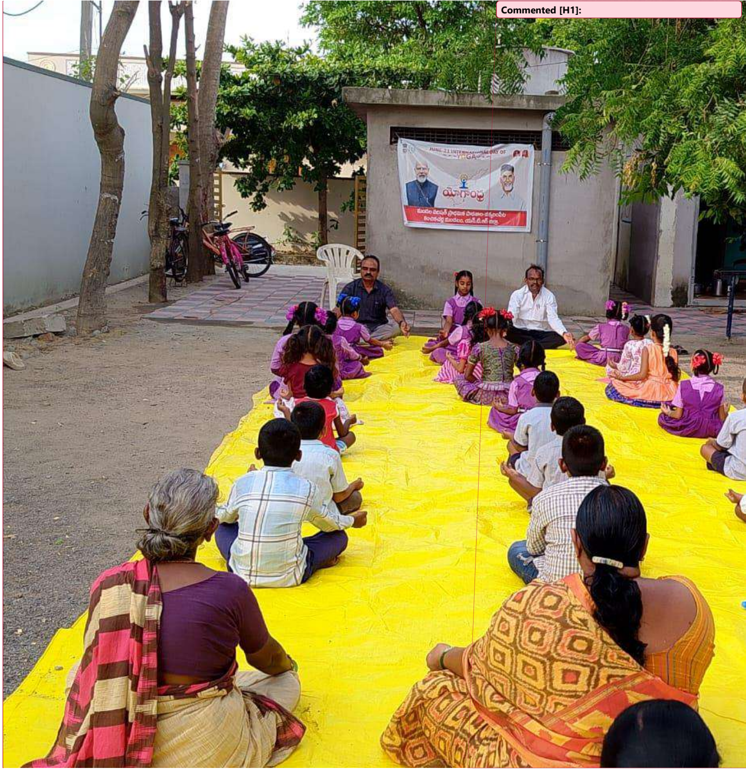
Figure 2 నెక్కలంపేట