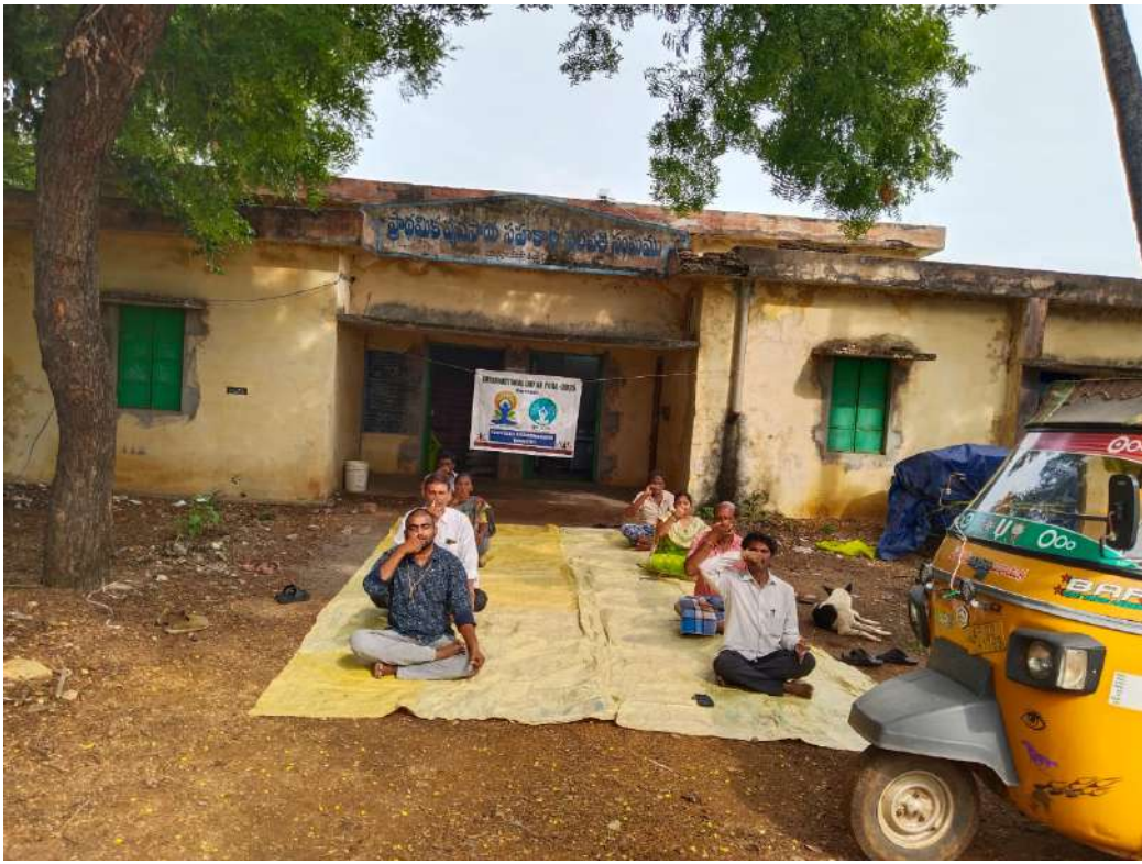
➤ కాటూరు ప్రాథమిక వ్యవసాయ సహకార సంఘం