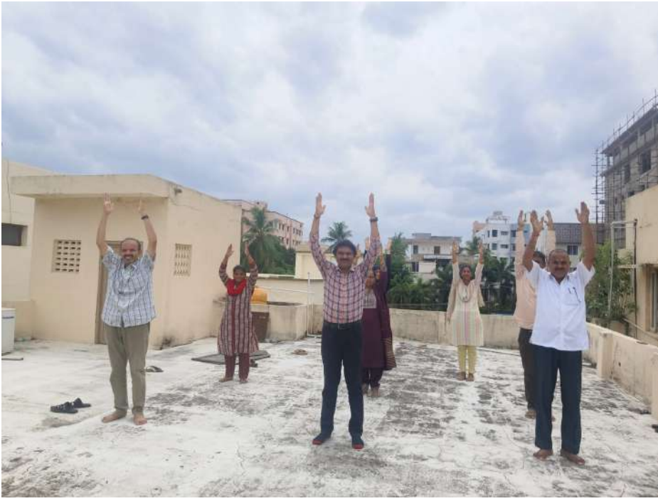
➤ విభాగ సహకార అధికారి వారి కార్యాలయము, తిరుపతి.