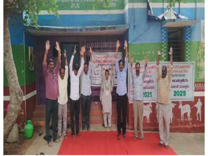
International Yoga Day conducted at District Cooperative Office and District Cooperative Audit Office, Sri Sathya Sai District, Puttaparthi.