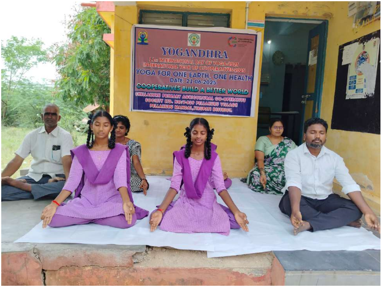
➤ చిల్లకూరు ప్రాథమిక వ్యవసాయ సహకార సంఘం