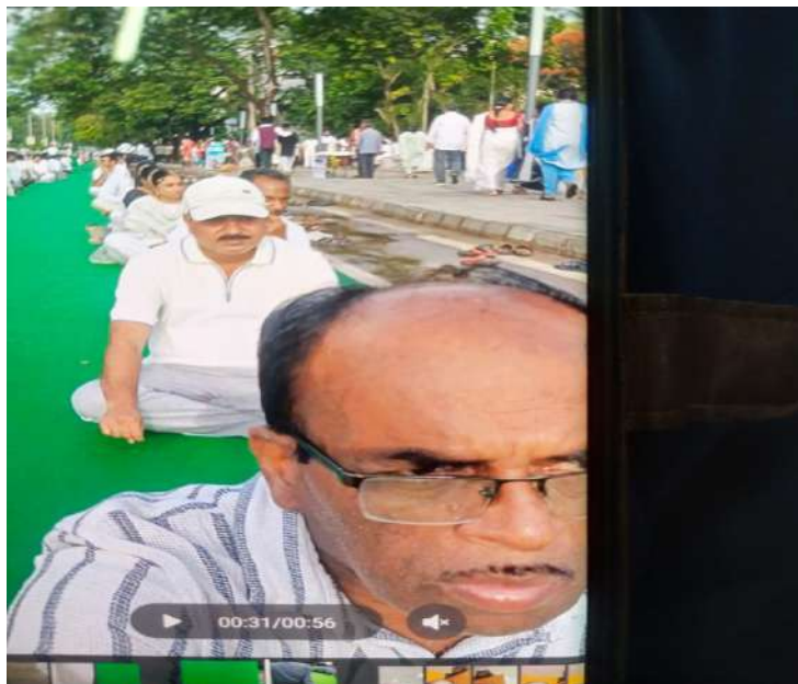
Divisional Cooperative Officer, Rajamahendravaram along with office staff