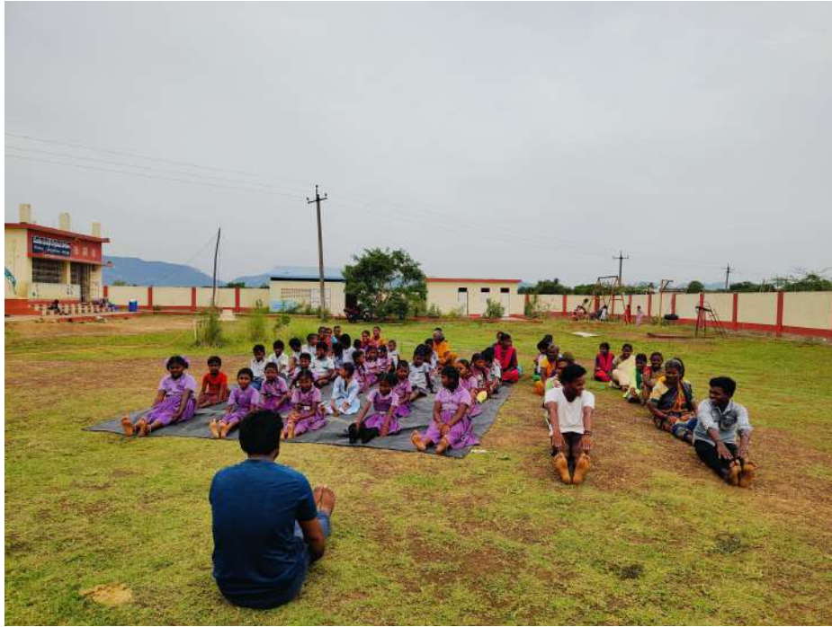
➤ సత్యవేడు ప్రాథమిక వ్యవసాయ సహకార సంఘం