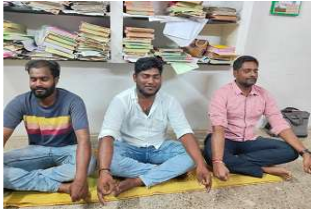
పసుపుల ప్రాథమిక వ్యవసాయ సహకార సంఘం