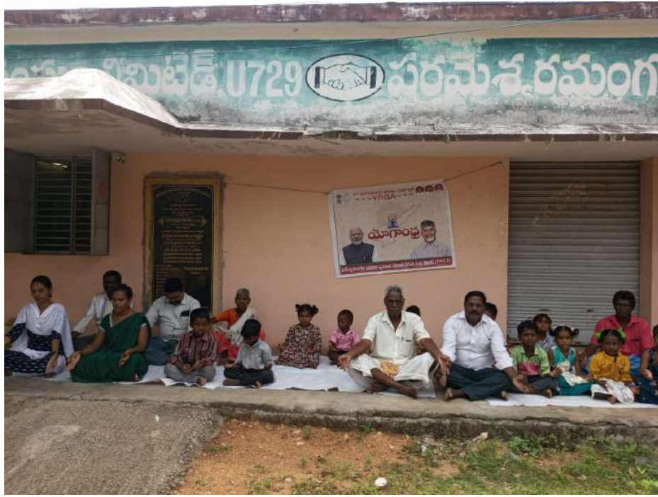
➤ పరమేశ్వరమంగళం ప్రాథమిక వ్యవసాయ సహకార సంఘం