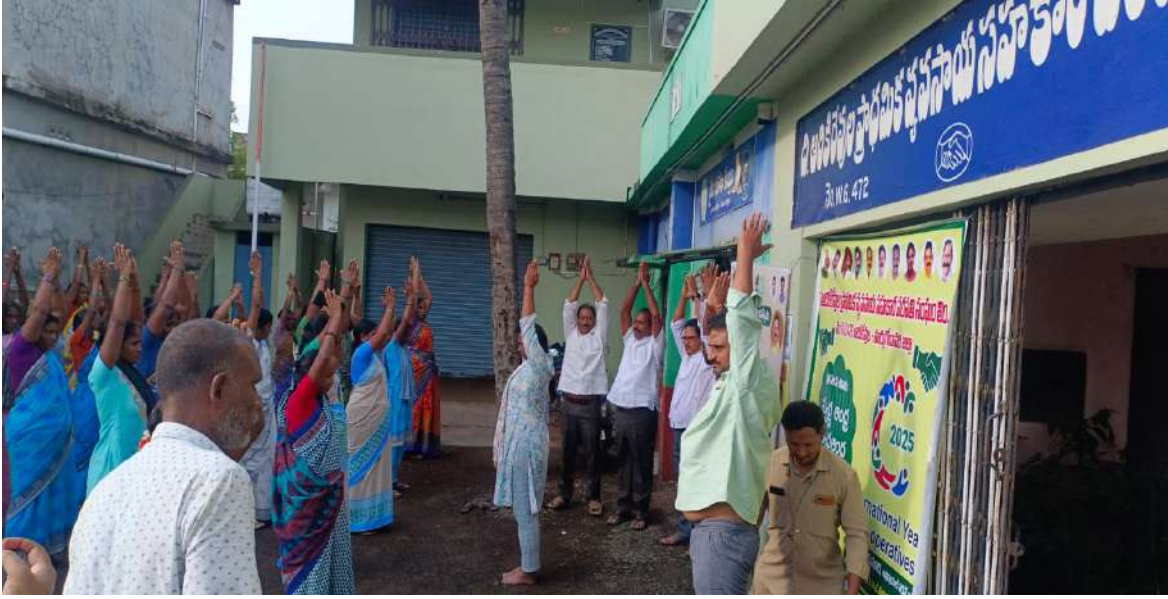
The Arekarevula PACS