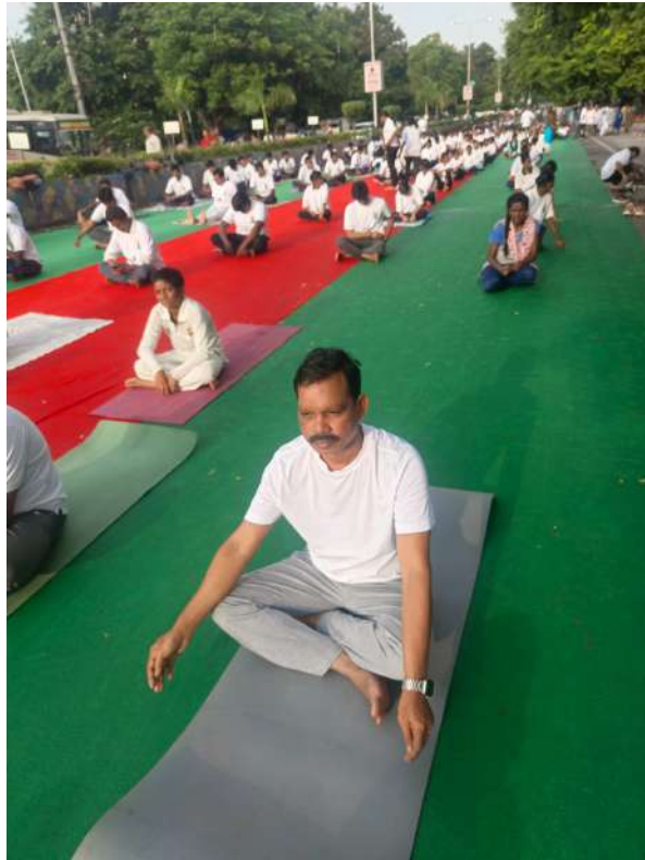
District Cooperative Audit Officer, along with Office staff