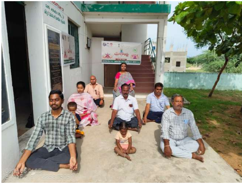
➤ వడమాలపేట ప్రాథమిక వ్యవసాయ సహకార సంఘం