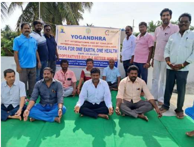
Indukurpet CACS Nellore Division