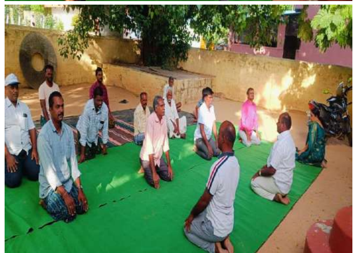
International Yoga Day conducted at Gunipalli PACS