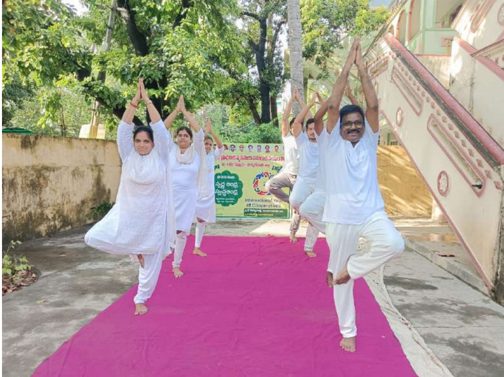
Staff of Divisional Cooperative Office, Kovvuru