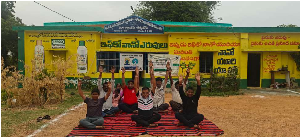
➤ తంగేళ్ళపాళెం ప్రాథమిక వ్యవసాయ సహకార సంఘం