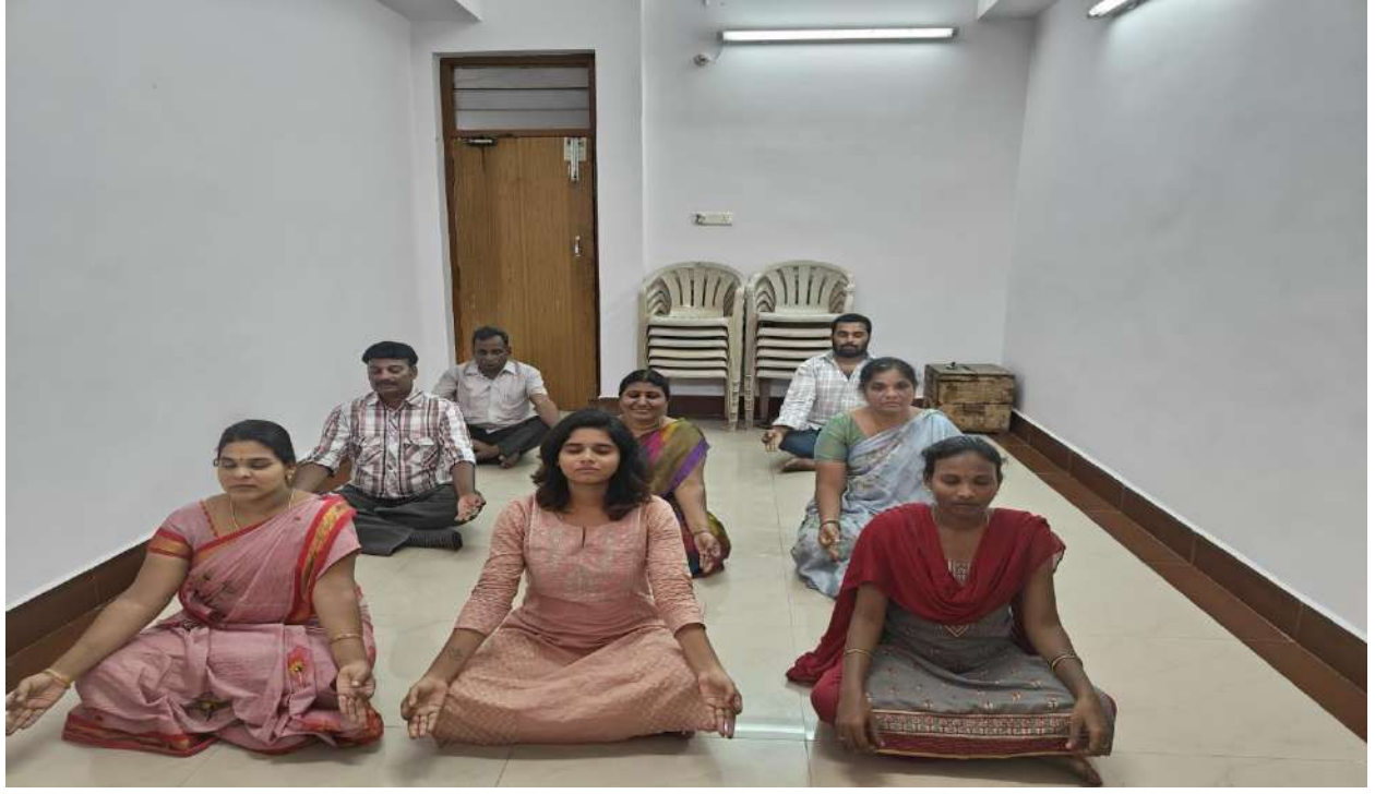
విభాగ సహకార అధికారి కార్యాలయము, చిత్తూరు: