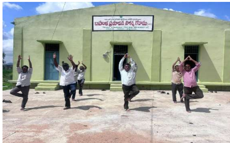
International Yoga Day conducted at Mandalapalli PACS