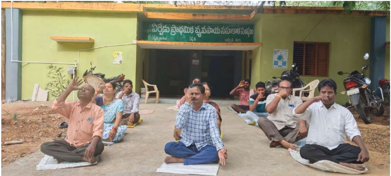
➤ ఏర్నేడు ప్రాథమిక వ్యవసాయ సహకార సంఘం