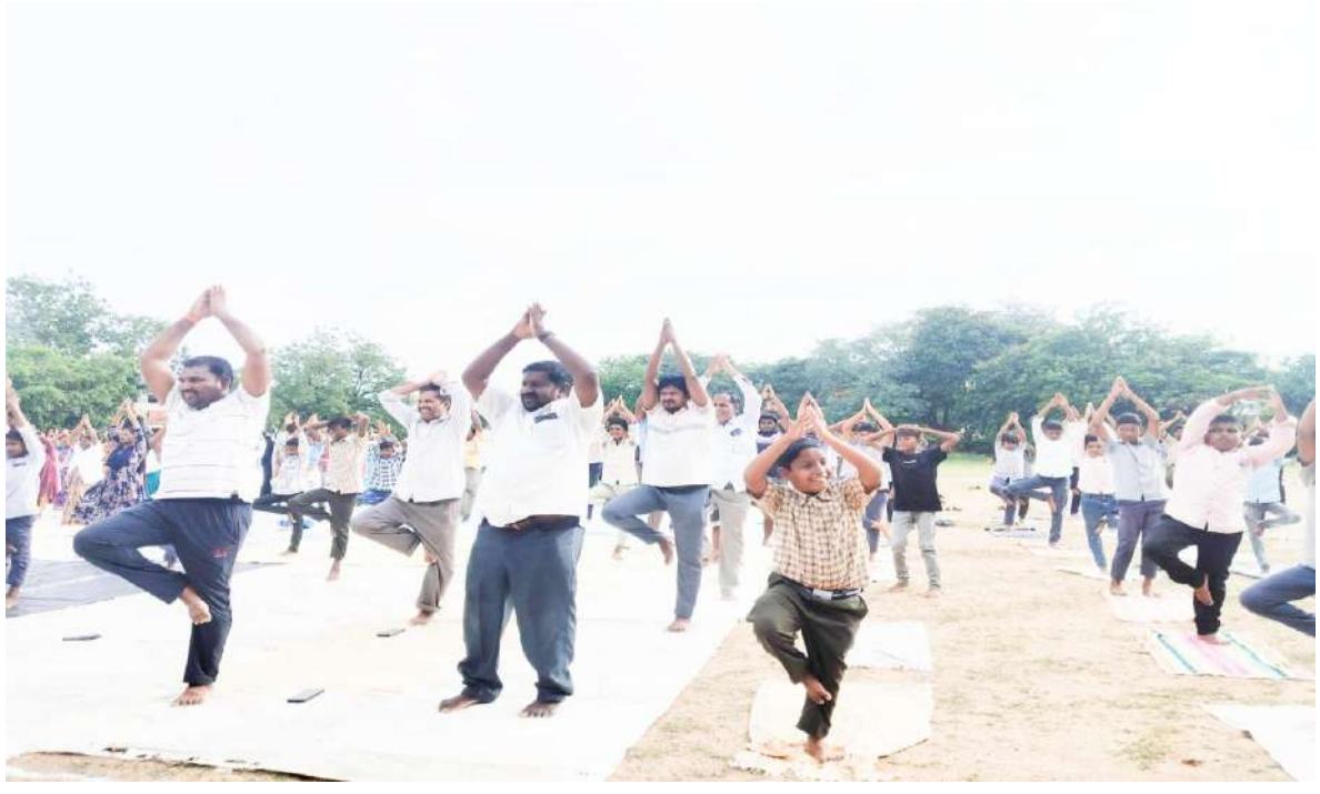
B. Koduru PACS