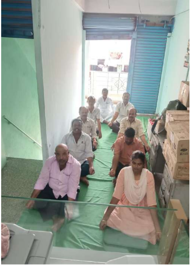
International Yoga Day conducted at Sydapuram PACS