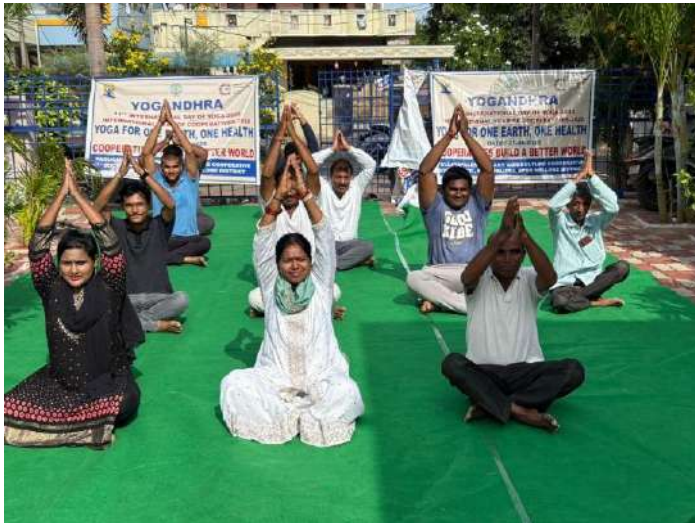
SDLCO Kovuru, Padugupadu PACS