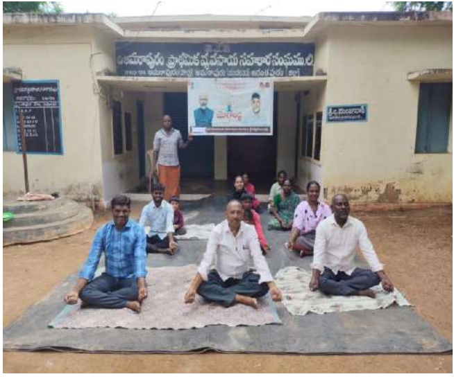
International Yoga Day conducted at Amarapuram PACS