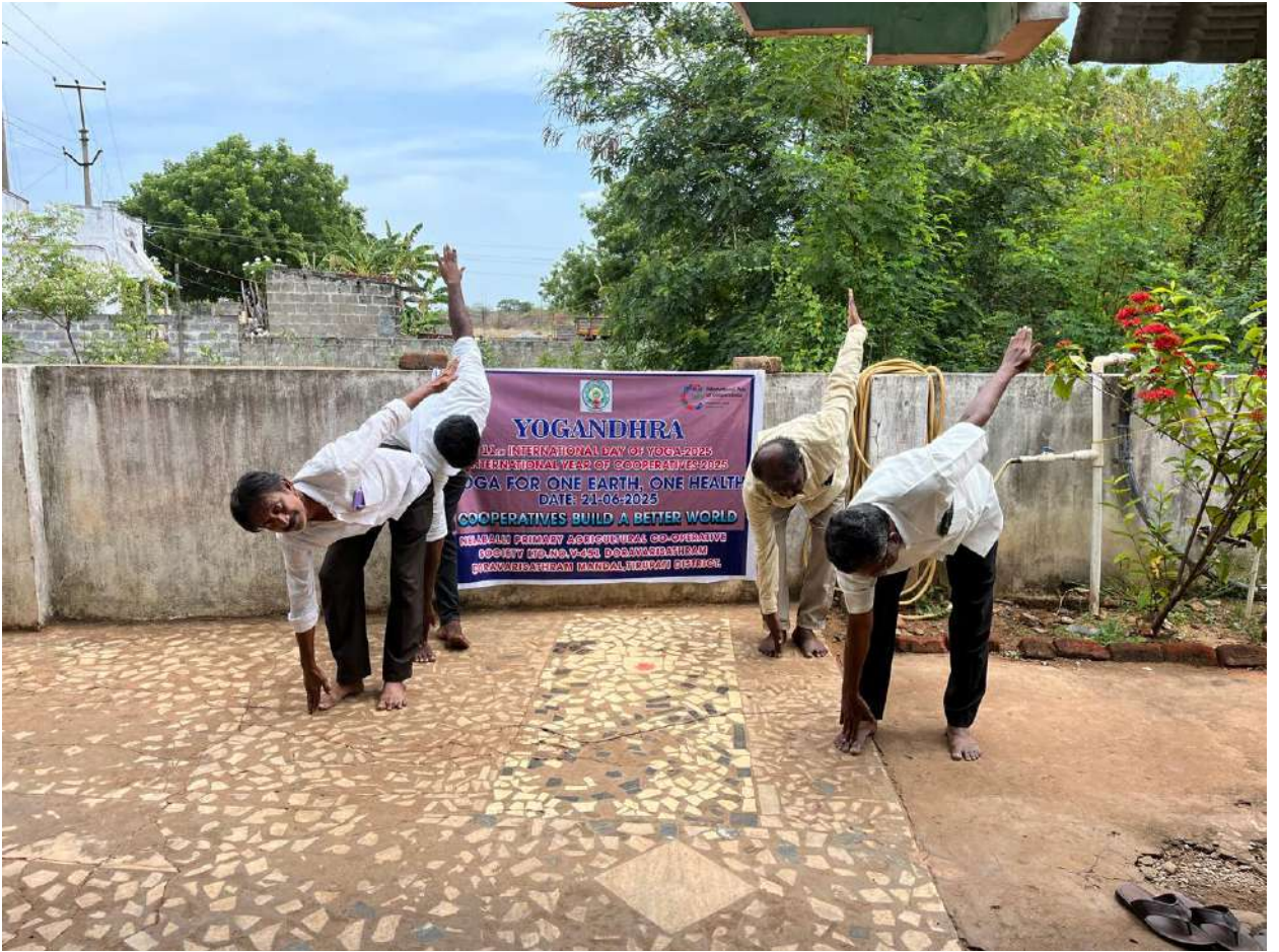
నెలబల్లి ప్రాథమిక వ్యవసాయ సహకార సంఘం