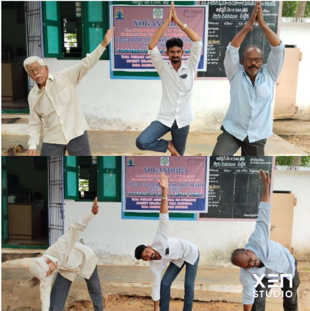
➤ తడ ప్రాథమిక వ్యవసాయ సహకార సంఘం