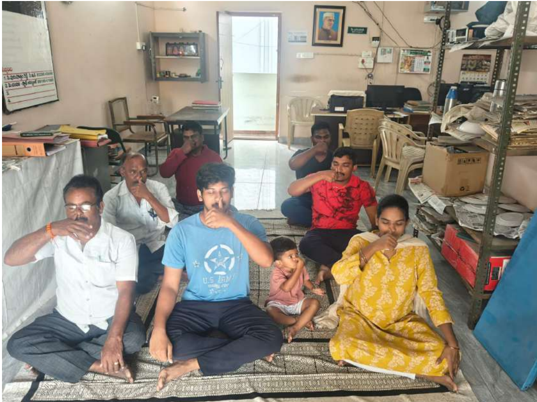
➤ రేణిగుంట ప్రాథమిక వ్యవసాయ సహకార సంఘం