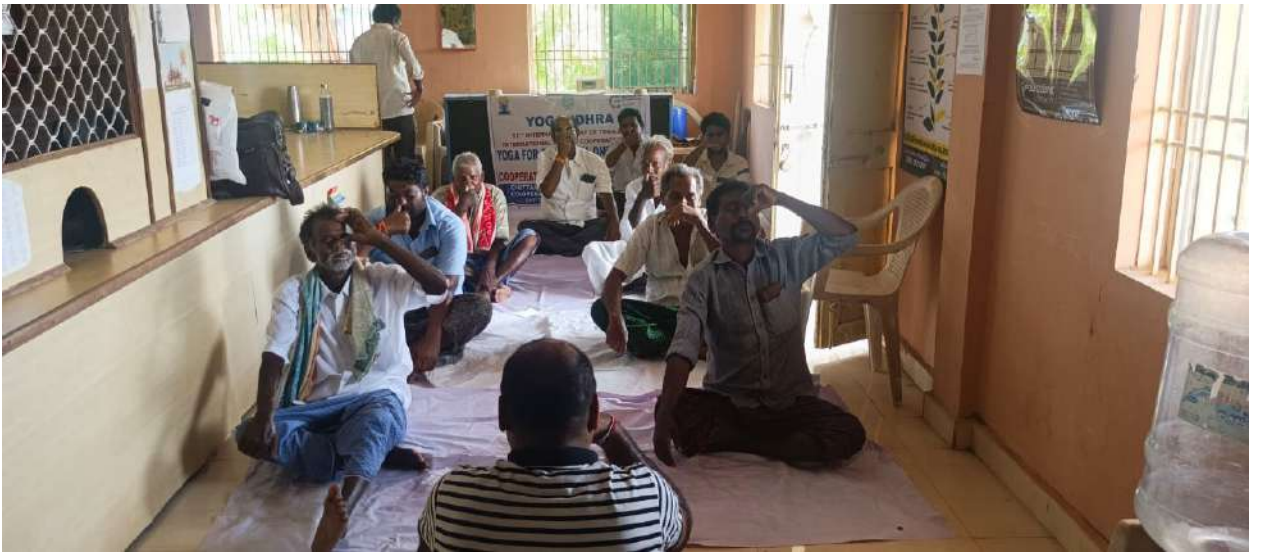
చిట్టమూరు ప్రాథమిక వ్యవసాయ సహకార సంఘం