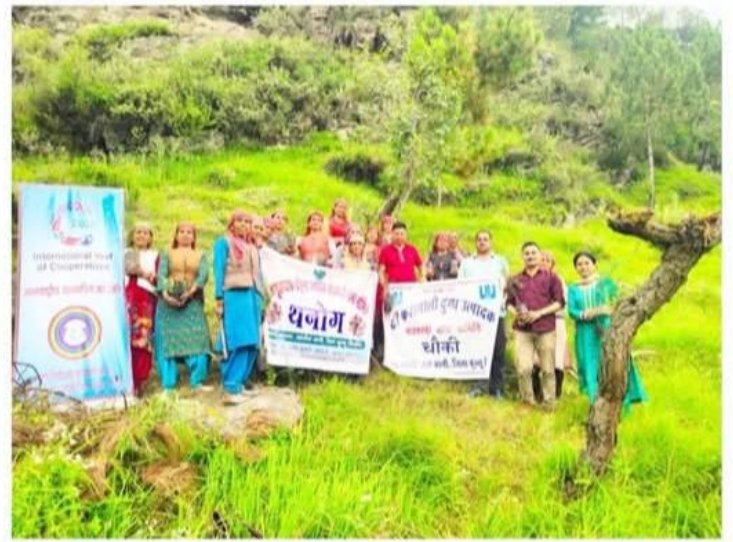
विभाग अधिकारियों के साथ ग्रामीणों ने किया पौधरोपण

डिजिटल मीडिया आनी (4जुलाई, 2025) सहकारिता विभाग आनी ने अंतर्राष्ट्रीय सहकारिता वर्ष 2025 के उपलक्ष्य में सहकारी सभाओं की अभूतनाथ महिला दुग्ध उत्पादक सहकारी सभा व दी फ्रानाली दुग्ध उत्पादक सहकारी सभा के साथ मिलकर थनोग में एक पौधरोपण कार्यक्रम आयोजित किया। इस कार्यक्रम का उद्देश्य पर्यावरण संरक्षण और सहकारिता के मूल्यों को बढ़ावा देना था। कार्यक्रम में सहकारिता विभाग के अधिकारियों और सहकारी सभाओं के सदस्यों ने भाग लिया और पौधरोपण