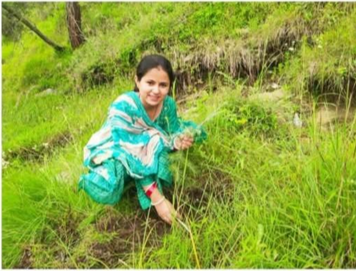
Digital Media Anni