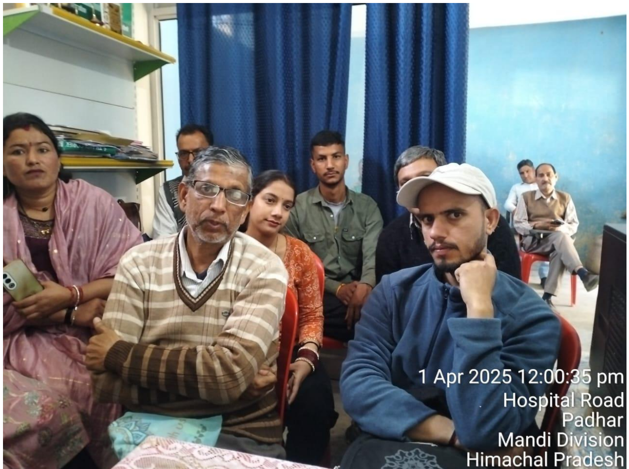
1 Apr 2025 12:00:35 pm Hospital Road Padhar Mandi Division Himachal Pradesh