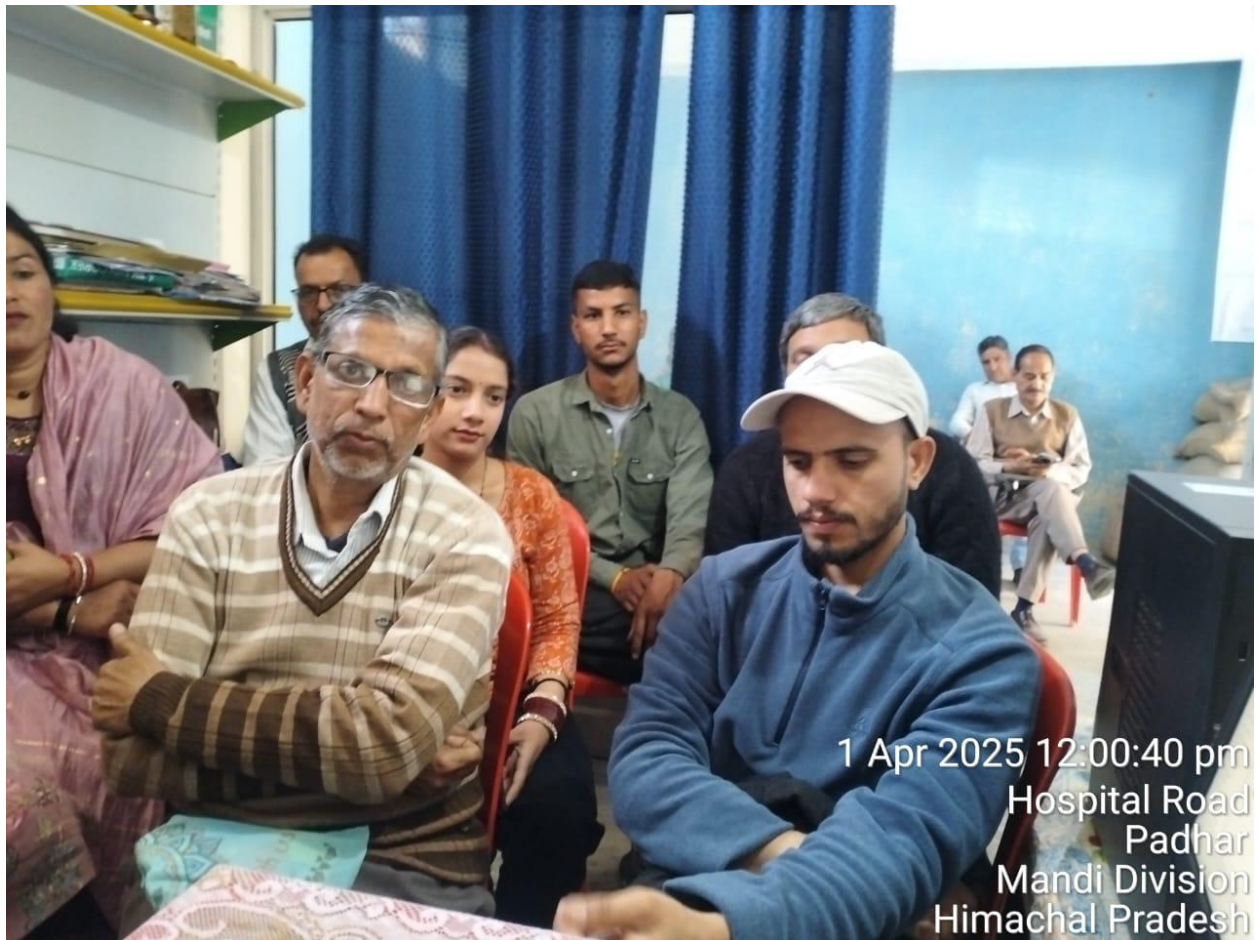
1 Apr 2025 12:00:40 pm Hospital Road Padhar Mandi Division Himachal Pradesh