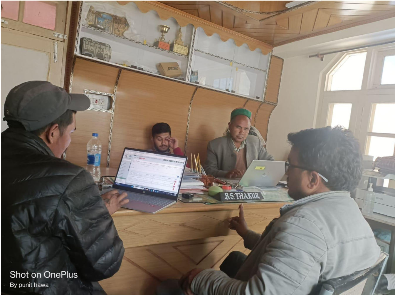
Shot on OnePlus By punit hawa