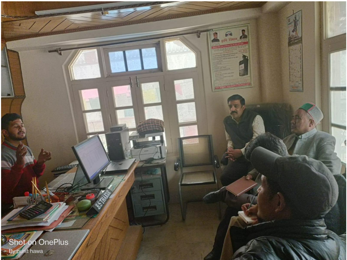
Shot on OnePlus By punit hawa