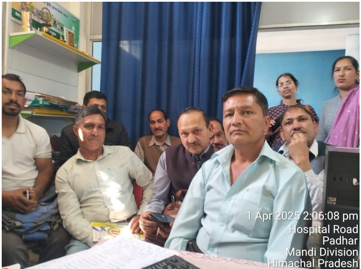
1 Apr 2025 2:06:08 pm Hospital Road Padhar Mandi Division Himachal Pradesh