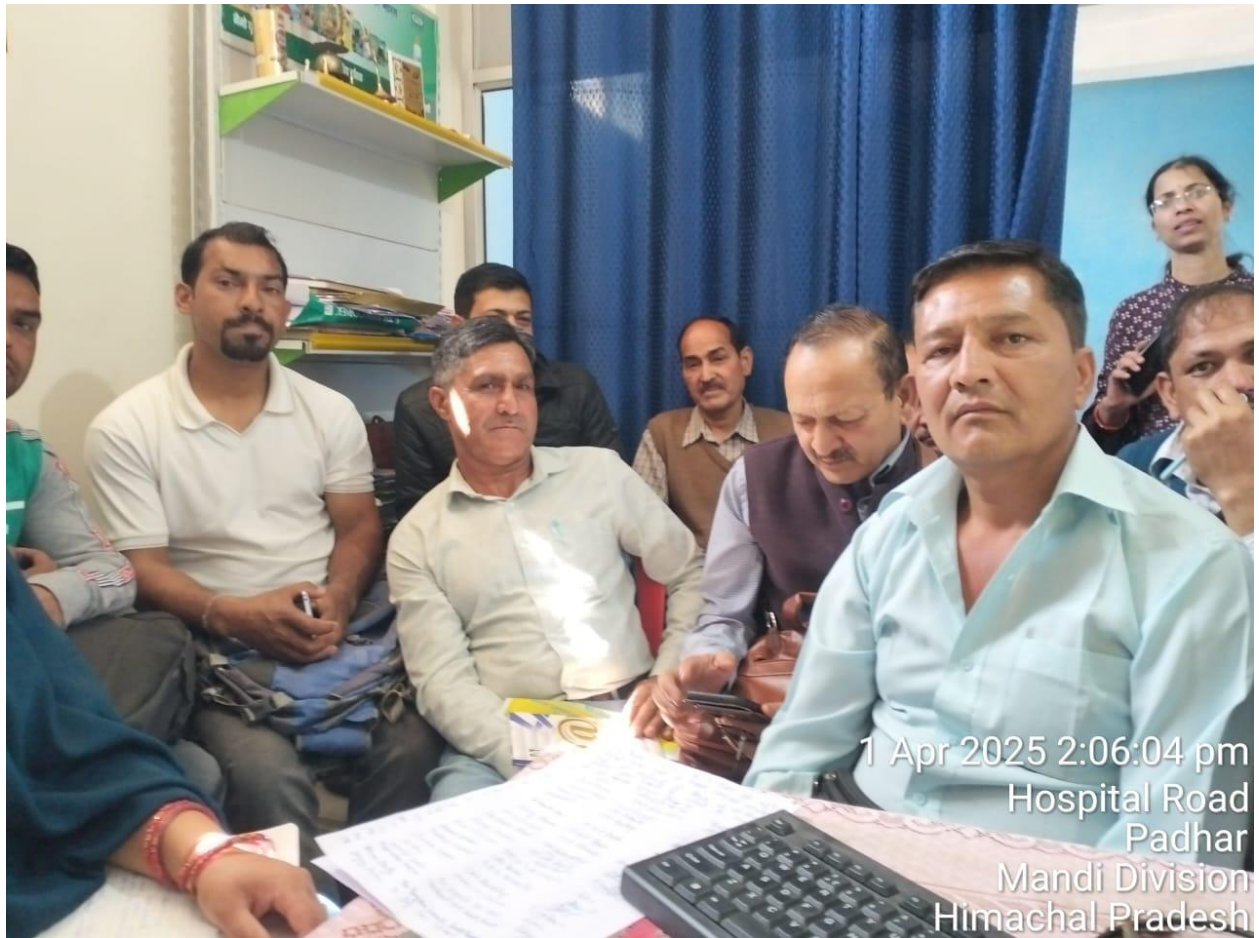
1 Apr 2025 2:06:04 pm Hospital Road Padhar Mandi Division Himachal Pradesh