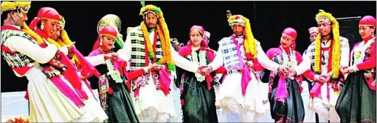
अटल सदन में आयोजित जिला स्तरीय कार्यक्रम में कुल्लूची नाटी प्रस्तुत करते कलाकार। संवाद