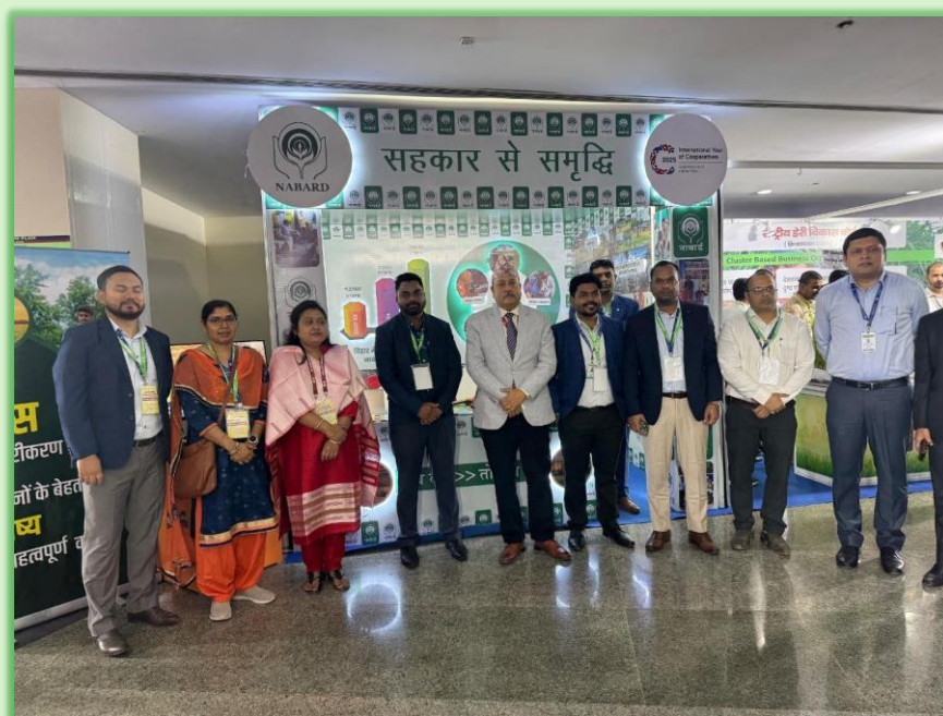
NABARD Team led by CGM, NABARD, Bihar RO