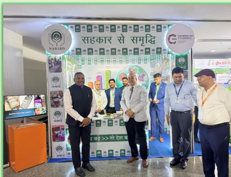
Chief Secretary, GoB at NABARD Stall