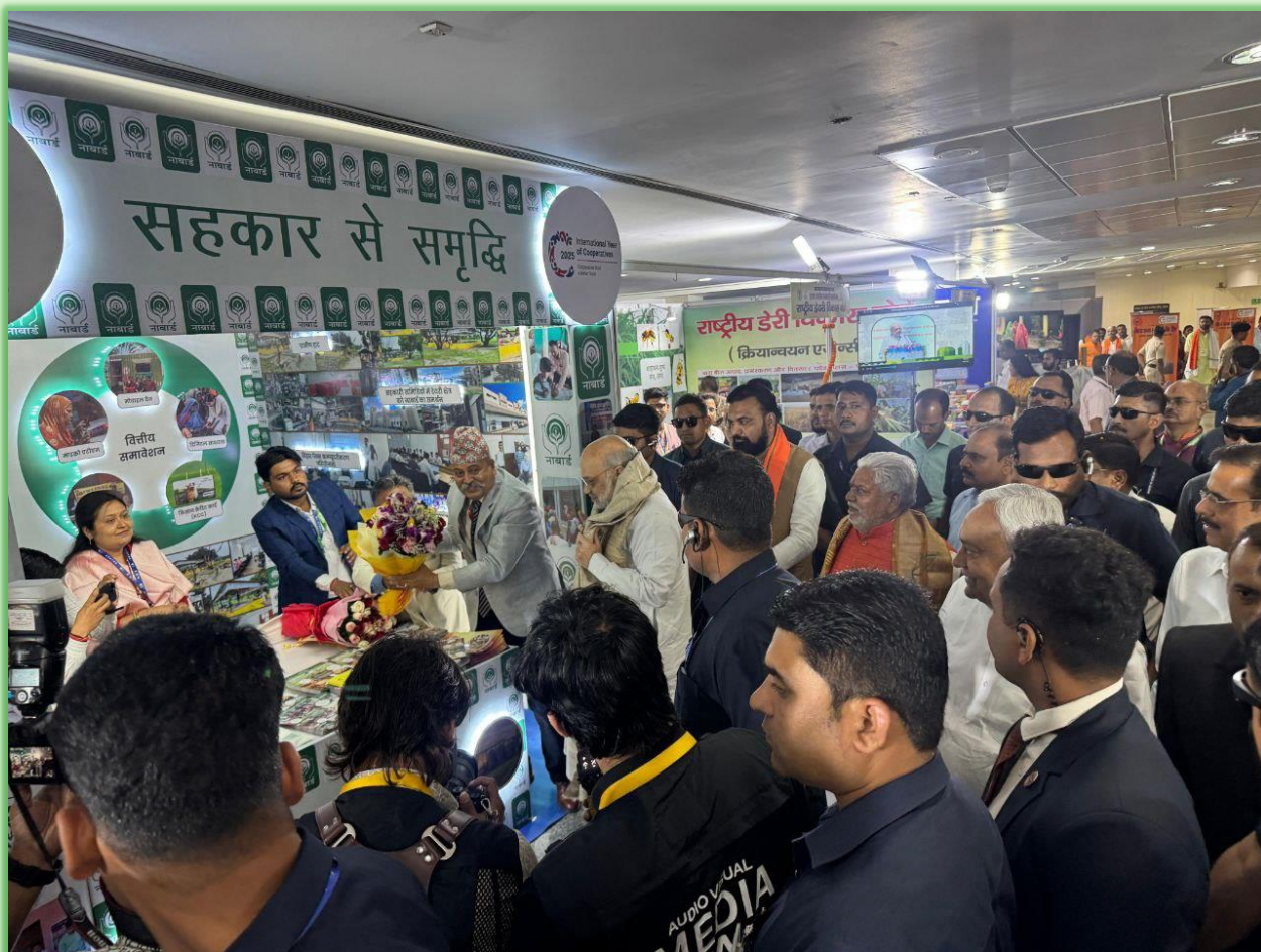
Hon'ble Home & Cooperation Minister, GoI, Chief Minister, Bihar, Dy. CM, Bihar and Cooperation Minister, GoB at NABARD Stall.