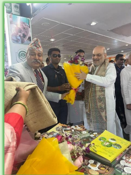
CGM, NABARD, welcoming Hon'ble Home and Cooperation Minister, GoI