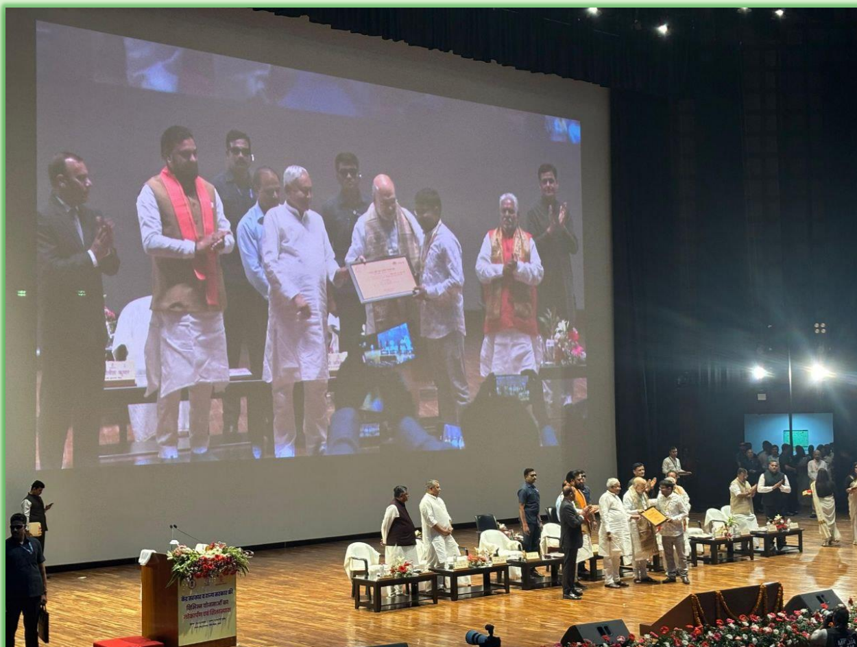
Handing over of NABARD's sanction letter of Rural Haat to Vikrampur PACS, Gopalganj, Bihar by Hon'ble Home & Cooperation Minister, Shri Amit Shah