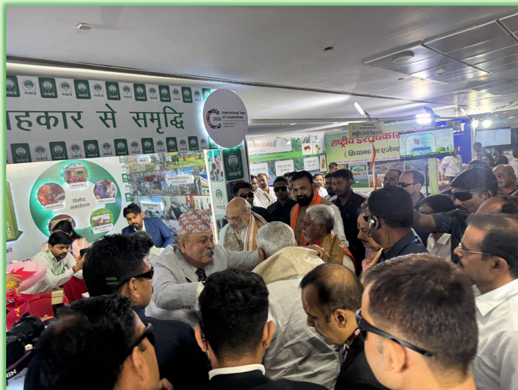
CGM, NABARD, welcoming Hon'ble Chief Minister of Bihar