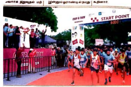
ஹெல்துறை சார்பில் சென்னையில் நடைபெற்ற மாரத்தான் போட்டியை அமைச்சருடைய, சேகர்ப்பு ஆகியோர் கொடியசைத்து தொடங்கி வைத்தபோது எடுத்த படம்.